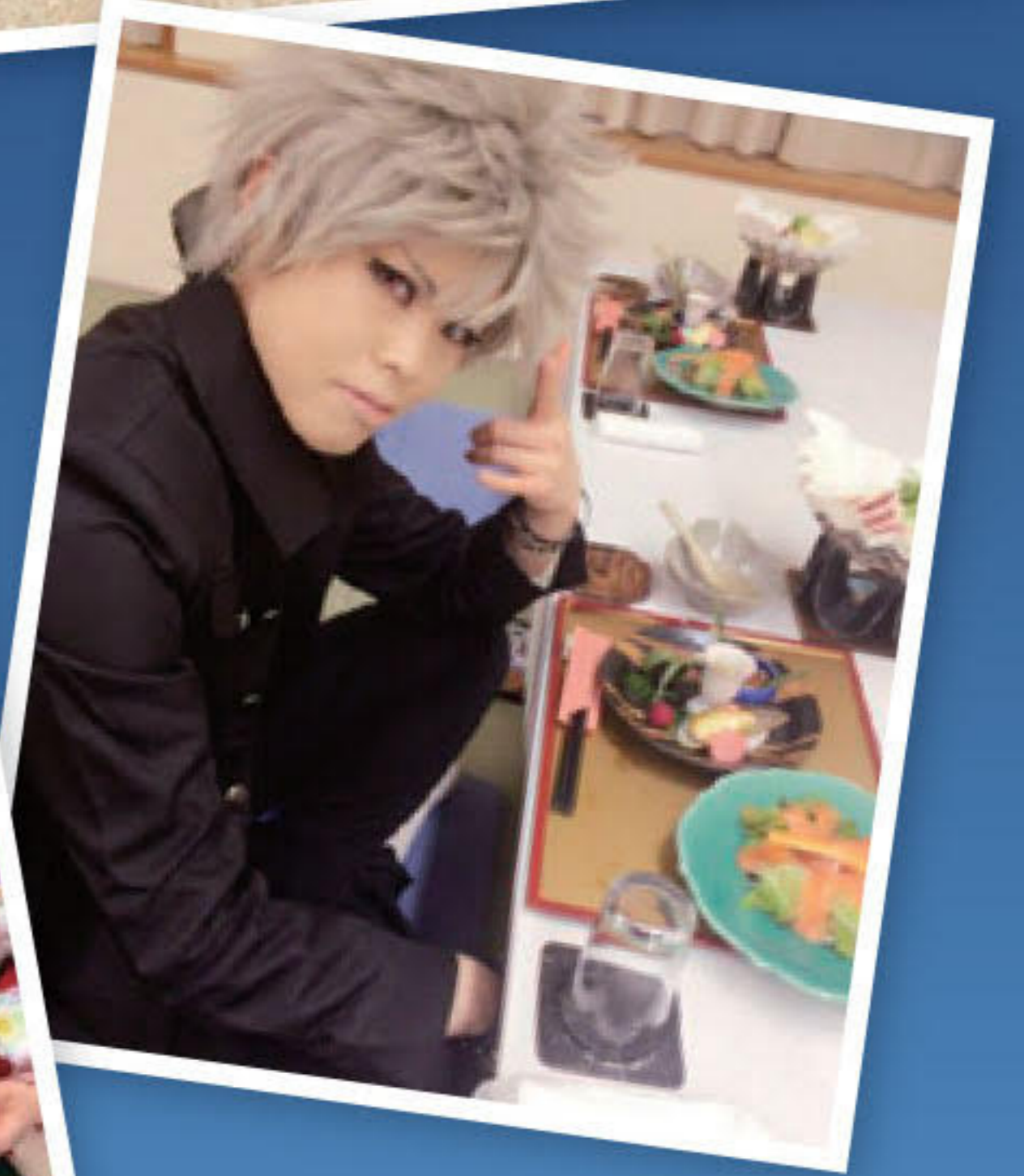
「湯郷スパコス2016・桜ステージ」より